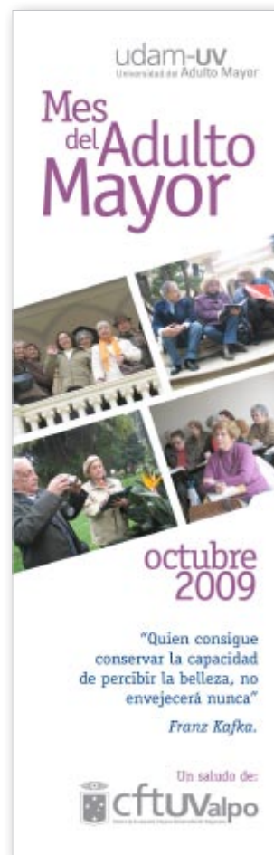
Afiche conmemorativo "Mes del Adulto Mayor 2009" UDAM-UV.