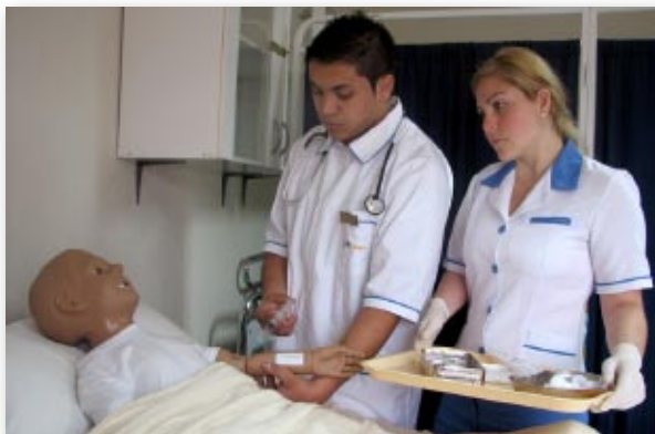
Alumnos de la Carrera Técnico de Nivel Superior en Enfermería en el laboratorio de simulación.

"La Enfermería es una actividad innata y fundamental del ser humano y, en su forma organizada, constituye una disciplina o ciencia sanitaria en sí misma. Su responsabilidad esencial es ayudar a los individuos y grupos (familia/comunidad) a funcionar de forma óptima en cualquier estado de salud en