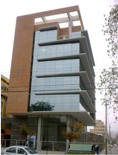
Edificio Rokamar, nueva sede del CFT UValpo