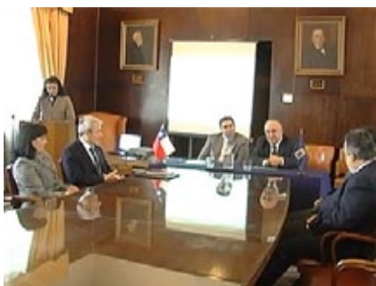
Convenio suscrito el viernes 11 de junio en Sala de Consejo "Decano Italo Paolinelli Monti", Facultad de Derecho y Ciencias Sociales, UV