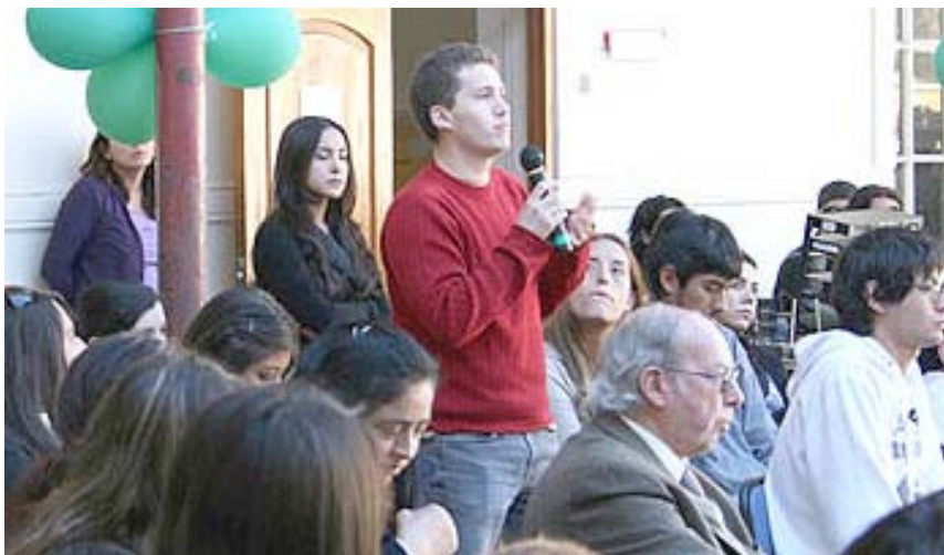
Alrededor de 200 estudiantes de doce instituciones de educación superior de la Región de Valparaíso se dieron cita en el Foro.

http://noticias.123.cl http://www.injuv.gob.cl http://www.puranoticia.cl