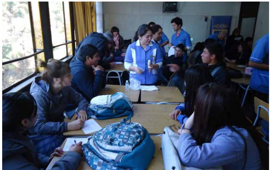
Alumnos(as) de tercer semestre de TNS en Enfermería presentando la charla "Sexualidad Responsable" en el Liceo Técnico-Profesional Barón, Valparaíso.

En cuanto al contenido de las charlas, los temas escogidos para la actividad fueron "Higiene y aseo", "Alimentación saludable, "VIH" y "Condiloma acumulado" (enfermedad de transmisión sexual causada por el virus del papiloma humano), dirigidos a una población escolar actualmente muy vulnerable a estas problemáticas, los que fueron especialmente solicitadas por los directores y coordinadores de los colegios visitados, previo contacto realizado personalmente por la profesora Collarte.