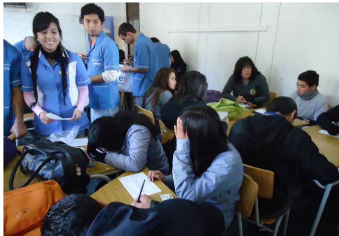
Alumnos(as) de tercer semestre de TNS en Enfermería presentando la charla “Sexualidad Responsable” en el Liceo Técnico-Profesional Barón, Valparaíso.

Entre las temáticas de los proyectos destacan la vida saludable, el manejo del agua y la sexualidad segura, entre otras (ver ficha). En tanto que los lugares de ejecución correspondieron a comunidades rurales o educativas de