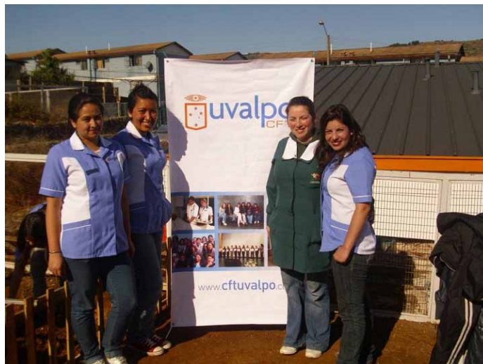
Alumnos(as) de tercer semestre de TNS en Enfermería en la actividad “Creación de huerto y fomento de la vida saludable”, en el jardín infantil “Los Pinitos” de Reñaca Alto, Viña del Mar.