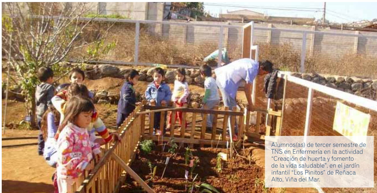
Alumnos(as) de tercer semestre de TNS en Enfermería en la actividad "Creación de huerta y fomento de la vida saludable", en el jardín infantil "Los Pinitos" de Reñaca Alto, Viña del Mar.